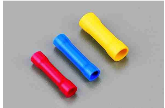
INSULATED BUTT CONNECTORS